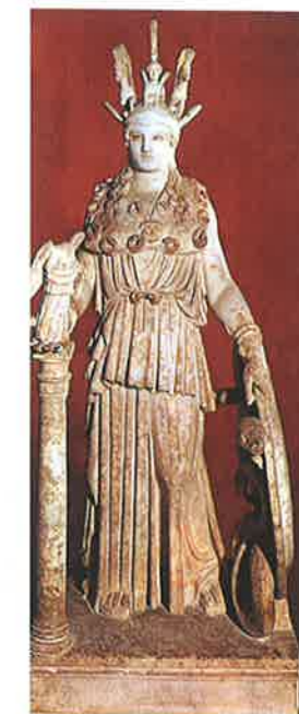
▲ Obr. 114 Tato mramorová socha je zmenšenou replikou monumentální sochy Pallas Athény, kterou pro Parthenon vytvořil Feidias. Socha (i s podstavcem vysoká 12 m) byla provedena technikou takzvané chryselefantiny (z řeckého chrysos – zlato a elefas – slon), kdy byla na dřevěné jádro sochy upevňována slonovina v místech, kde měla být nahá pokožka, a vlasy, šperky, zbroj a oděv byly zhotoveny ze zlatého plechu