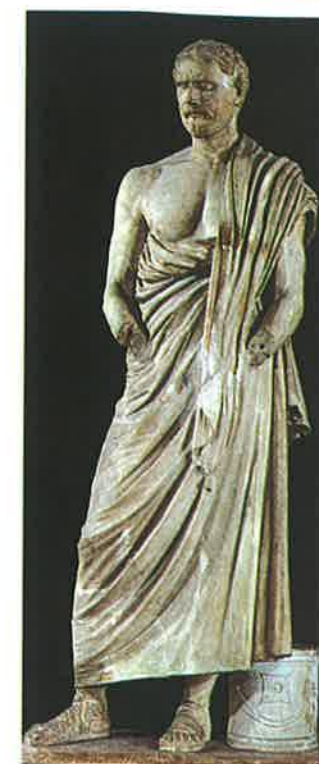
▲ Obr. 104 Demosthenes

veřejnost o správnosti svého postoje, záměru a názoru. Být dobrým řečníkem znamenalo také větší naději na vítězství v soudní při nebo ve volbách. Proto vznikala řada řečnických škol a směrů. Nejproslulejším řečníkem je Demosthenes , který vstoupil do historie zejména svými útočnými řeči proti Filippovi Makedonskému – takzvanými filipikami.