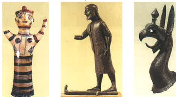
▲ Obr. 111 Drobná archaická plastika: a) Keramická mykénská figurka ze 13. století př. n. l. má ruce zvednuté pravděpodobně v adoračním gestu (tj. ke vzývání bohů) b) Bronzová soška muže z 8. století př. n. l. c) Tato hlavička griffina ze 7. století př. n. l. zdobila bronzovou trojnožku

s malým Dionýsem a Afrodítou Knidskou. Ideálem těchto sochařů bylo ztvárnit postavu v klidu či v zastaveném pohybu. Sochy vytvářeli z mramoru i z bronzu a polychromovali je, aby působily ještě realističtější dojmem. V helénistickém období opustilo řecké sochařství onen vznosný patos a stalo se hravým až rozverným. Oblíbeným tématem byli satyři a kentauři a dovádivé děti, často si hrající se zvířaty. V galerii helénistických sochařů se však můžeme setkat i se sochami s tak vážnými náměty, jako je umírající Gal. Většina řeckých soch se do našich časů bohužel nedochovala v originálech, ale jen v římských kopiích.