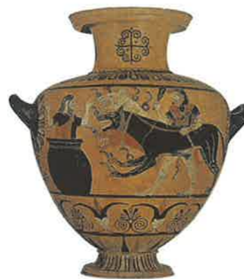
◀ Obr. 120 Tato černofigurová keramika (nádoba na vodu) je velmi pestrá, umělec užil nejen černou a bílou, ale i červenou barvu, aby zachytil scénu, v níž přivádí Herakles trojhlavého podsvětího psa Kerbera mykénskému králi Eurystheovi, který ho tímto úkolem pověřil. Vyděšený Eurystheus se schovává do zásobnice na obilí

Nejstarší výtvarný styl pevninského Řecka se nazývá geometrický . Nádoby takto zdobené jsou buď pokryty jenom ornamenty tvořenými tenkými liniemi, nebo jsou mezi jejich pruhy vkomponovány i pásy s figurální kresbou (zástupy vojáků, pohřební výjevy, koně zapřažené do vozu). V 6. století př. n. l. se objevil nový styl výzdoby – černofigurový . Na přirozený červenohnědý podklad nádoby se malovaly černé postavy, jejichž detaily (řasení oděvu, rysy obličeje, modelace svalů) se do černé barvy vyryly, takže prosvítala barva nádoby. Jen pleť zobrazených žen se někdy malovala bíle. V poslední čtvrtině tohoto století přešli malíři váz k dalšímu, ještě dokonalejšímu stylu – červenofigurovému . Tentokrát se v barvě nádoby ponechaly postavy a zbytek se natřel na černou. Na červenavý podklad se pak tenkým štětečkem nebo perem snadno černou barvou vykreslily potřebné detaily. Kresba tak byla jem-