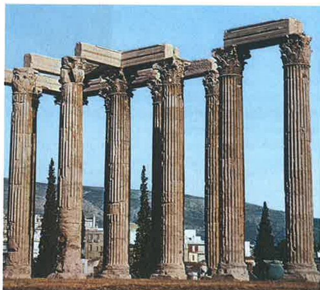
▼ Obr. 110 Athénské Olympieion, chrám Dia Olympského, je ukázkou helénistické architektury, ačkoli s jeho stavbou začal už Peisistratos. Bylo však několikrát přestavováno a dokončeno až ve 2. století n. l. Korintské sloupy pocházejí z první čtvrtiny 2. století př. n. l.

mohli nanejvýš do chrámové před síně. Větší chrámy měly ještě zadní místnost sloužící jako pokladnice.