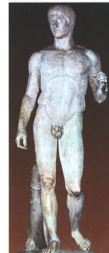
► Obr. 115 Polykleitos: Doryforos („nesoucí kopí“). Proporce této nejproslulejší Polykleitovy sochy byly pokládány za tak dokonalé, že byla nazývána kánonem (kánon zde znamená harmonický soubor proporcí ideálního těla)