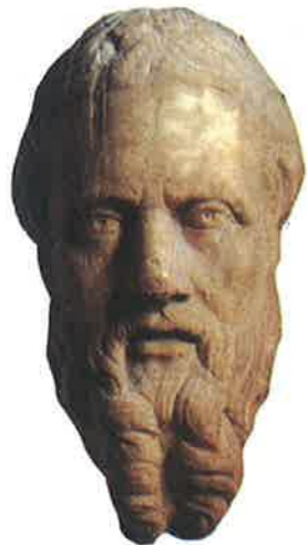
◀ Obr. 105 Herodotos, „otec dějepisu“, pocházel z Halikarnassu a procestoval nejen celé Řecko, ale i Egypt a Babylonii. Sepsal dějiny východních národů do roku 500 př. n. l. a dějiny řecko-perských válek do roku 478 př. n. l.