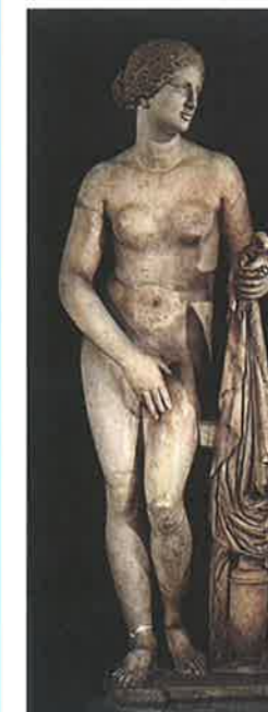
▼ Obr. 113 Afrodite Knidská je dílem vrcholného období Praxitelovy tvorby. Praxiteles byl první, kdo se odvážil Afrodítu zobrazit nahou. Socha byla polychromována, ale pouze mírně – barva zvýrazňovala oči, rty a vlasy