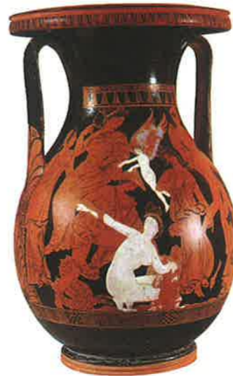
◀ Obr. 121 Malba na této váze patří k mistrovským dílům umělců červenofigurové keramiky. Znázorňuje únos mořské bohyně Thetidy králem Peleem. Jejich synem byl Achilles. Ačkoli je na výjevu více ženských postav, bílá barva byla použita jen na tělo Thetidy, která je ústředním tématem obrazu. Bílý je rovněž Eros vznášející se nad budoucími manžely

nější a dokonalejší. Pokud se používala bílá barva, opět jen na ženské tělo. Oba poslední styly čerpaly své náměty z mytologie, ale nevyhýbaly se ani výjevům z každodenního života (trénink atletů, válečné tažení, škola, akrobatů atd.).