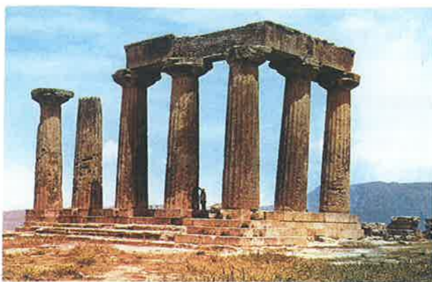
▲ Obr. 108 Apollonův chrám v Korintu je jedinou stavbou, která přežila zničení města Římany roku 146 př. n. l. Pochází ze 6. století př. n. l. a je vybudován v dórském slohu