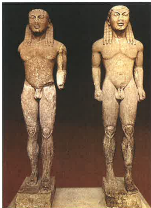
▲ Obr. 112 Kleobis a Biton byli synové Hériny kněžky z Argu. Když jednou jejich matka neměla spřežení, které by ji dovezlo do svatyně, bratři se sami zapřáhli do matčina vozu. Kněžka poté požádala Héru, aby jejím synům darovala to, co je pro smrtelníky nejkrásnější – a Héra jim dopřála milosrdnou smrt ve spánku. Argejští pak věnovali sochy mrtvých bratří do svatyně v Delfách, kde také byly nalezeny. Oba kúroi jsou v postojí typickém pro tento druh soch – mají nakročenou levou nohu a paže se zatáhlými pěstmi přitisknuté k tělu. Za povšimnutí stojí účes z dlouhých vlasů