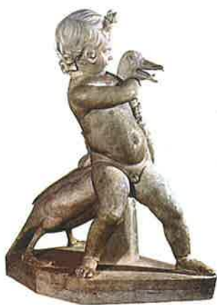
◀ Obr. 116 Oblíbeným helénistickým námětem byly děti a zvířata. Sousoší chlapečka s husou je velmi realistické, na první pohled je patrné, že huse se zacházení dítěte příliš nelíbí. Sousoší má jehlancovitou dispozici, která zvyšuje dynamičnost znázorněné scény