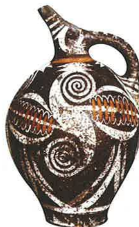
▶ Obr. 119 Krétská keramika, takzvaná kamarská, byla ještě modelovaná v ruce. Pochází z let 1900-1700 př. n. l. Na černém podkladu byla bílou a okrovou barvou vytvořena ornamentální výzdoba. Tento džbán pochází z paláce ve Faistu

ramika byla značně ovlivněna krétským uměním, proto se i v její výzdobě můžeme setkat s motivy inspirovanými mořskými živočichy. Válečnický ráz mykénského světa ovšem pronikl i do umění, takže se na keramice objevují také bojové náměty (řady válečníků a podobně).