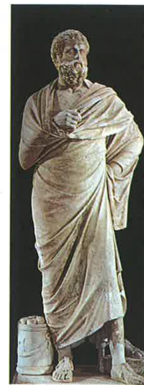
▲ Obr. 103 Sofokles

Rétorika (řečnictví) byla uměním, které musel nezbytně zvládnout každý občan, který se chtěl uplatnit na politické scéně. Kromě dobře připravené a přednesené řeči totiž neexistoval jiný způsob, jak přesvědčit