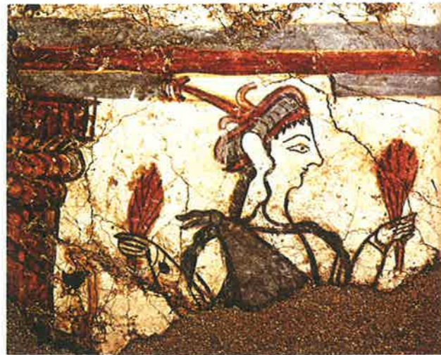
▲ Obr. 118 Freska z Mykén (13. století př. n. l.) zobrazuje ženu, patrně z vládnoucích kruhů, s obilnými klasy v rukou. Na této malbě je dobře patrné, že způsob znázorňování lidských postav je blízký egyptskému (hlava z profilu, oko zepředu)

Malba na keramice prošla dlouhým vývojem. Krétská keramika byla původně tmavá, zdobená bílými ornamenty s detaily v živých barvách. Později se začaly malovat na světlý podklad tmavší barvou rostlinné či mořské motivy (například chobotnice). Mykénská ke-