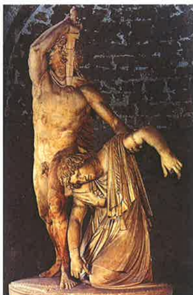
◀ Obr. 117 Gal zabíjející se nad svou mrtvou ženou. Toto sousoší (jde o originál) nechal zhotovit a věnoval do Athénina chrámu v Pergamu pergamský král Attalos I., vládnoucí na přelomu 3. a 2. století př. n. l., po vítězství nad Galaty – Galy. Zachycuje galského bojovníka ve chvíli, kdy si vráží do hrudi meč okamžik poté, co zabil svou ženu, jejíž mrtvé tělo ještě podpírá. Zachránil tak sebe i ji před nepřátelským zajetím