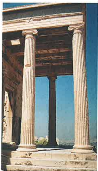
◀ Obr. 109 Severní předstř Echtheia na athénské akropoli je tvořena ionskými sloupy. Chrám pochází z konce 5. století př. n. l.